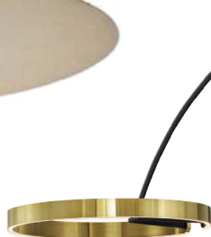
OCCHIO PAD. 13 STAND C 01, D 08