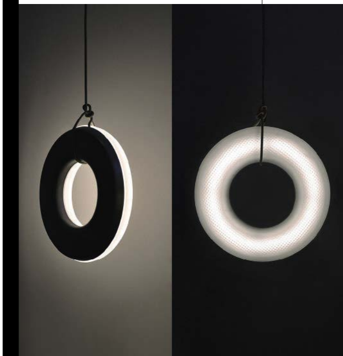
OIKOI Fuorisalone, via Solferino 11